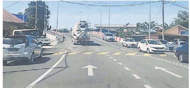
士毛月街上衔接万宜路的桥梁已通车。