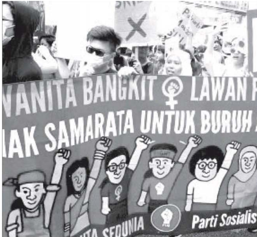
大马社会表面看是性别平等，但现实里依然存在著很多根深蒂固的性别歧视和性别标签。图为妇女日时，争取女权运动的游行队伍。

Provided for client's internal research purposes only. May not be further copied, distributed, sold or published in any form without the prior consent of the copyright owner.