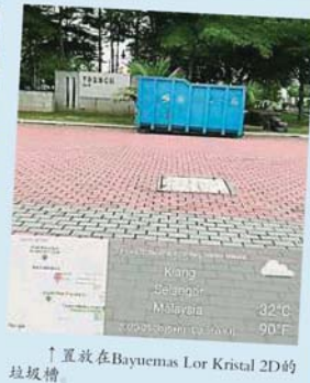
↑ 置放在Bayuemas Lor Kristal 2D的垃圾槽。