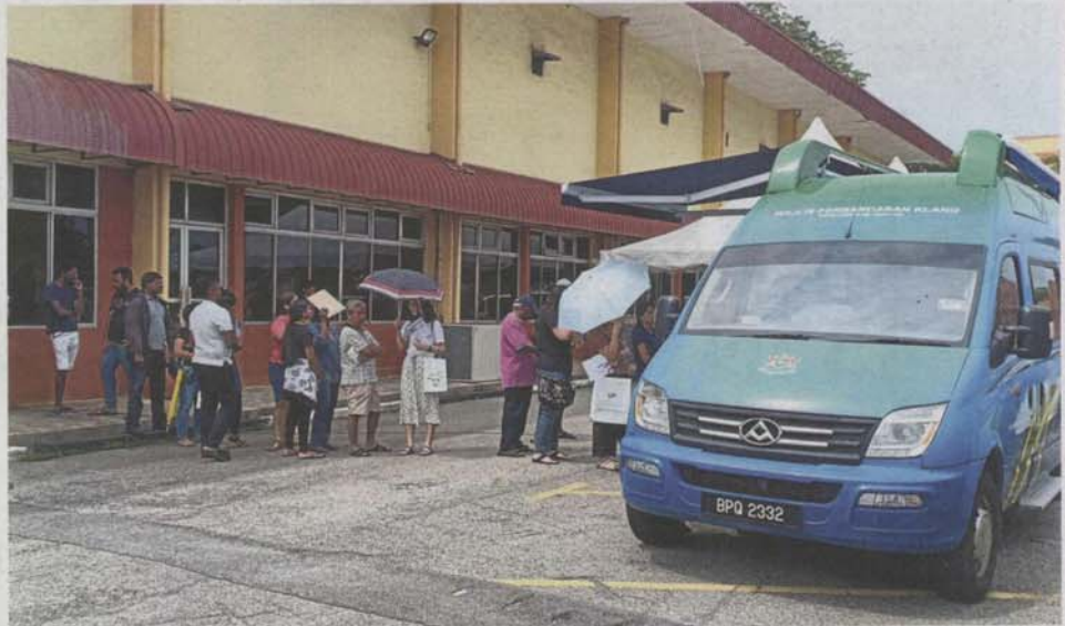
Dog owners queuing up to renew their dog licence at Kompleks Sukan Pandamaran in Port Klang.

"It is normal for the dog to be less active