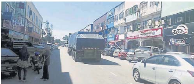
重型车辆可使用其他通道通往万宜路。