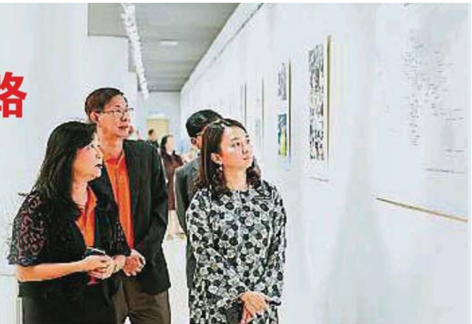
杨巧双(右起)和梅福才观赏图片展。

妇女及家庭发展部副部长杨巧双为这场图片展主持开幕致词时认同,帮助每个孩童活出丰盛生命的道路漫长且艰巨,但如果各方能团结一致和互相支持,将可实现这个梦想。全马来西亚人都有责任确保孩童找到对未来怀抱希