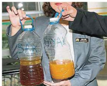
溝渠阻塞易釀一雨成災，而非把回鍋油隨便倒入溝渠，導致市民及熟食商販受促妥善處理回鍋油。

“市民亦可撥電019-375 9592或019-375 3980、免付費熱線1800 88 2824、Whatsapp 019-274 2824或電郵 iclean@kdebw.com要求清理服務。”