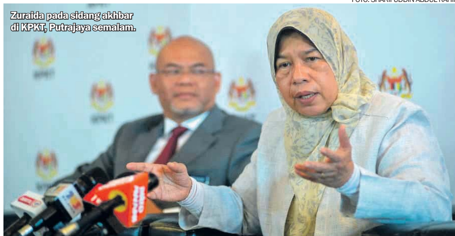
Zuraida pada sidang akhbar di KPKT, Putrajaya semalam.