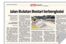
Laporan Sinar Harian semalam.

pek keselamatan di pihak kontraktor hingga mengakibatkan beberapa insiden kemalangan membabitkan orang awam beberapa minggu lalu.