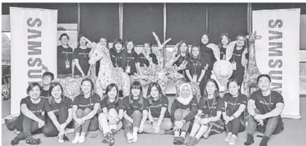
工作人员制作的大型动物模型会送给参与的学校。