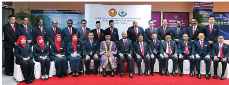
24位亚罗士打市议员宣誓后与亚罗士打市长拿督莫哈末佐迪 (坐着左6) 以及吉打州务大臣拿督斯里慕克里 (坐着左7) 合影。