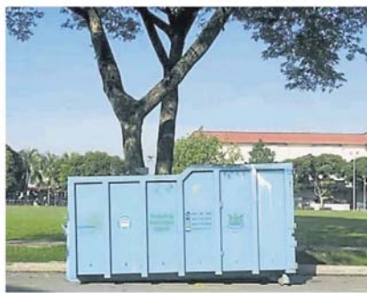
市议会将在圈定地点置放大垃圾槽, 以供市民丢弃大型垃圾物品。