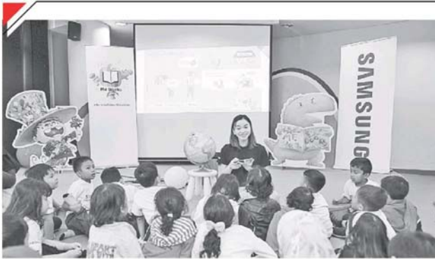
孩童在互动故事课堂上专心聆听。

Provided for client's internal research purposes only. May not be further copied, distributed, sold or published in any form without the prior consent of the copyright owner.