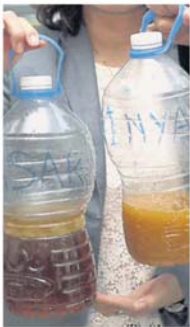
废弃食用油可收集再循环使用。